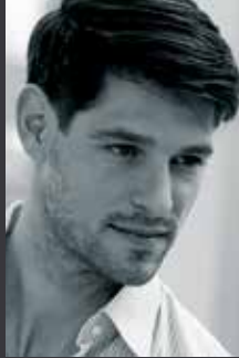
toupets 14 -17