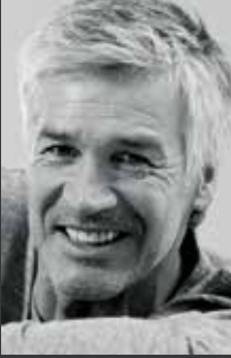
wigs 03 -13